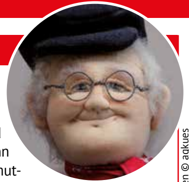
Text + Bildrechte Opa Lingen © agkues

Trotzdem – viel Spaß beim kommenden Schlussverkauf! Da kann man sicher das eine oder andere echte Schnäppchen machen.