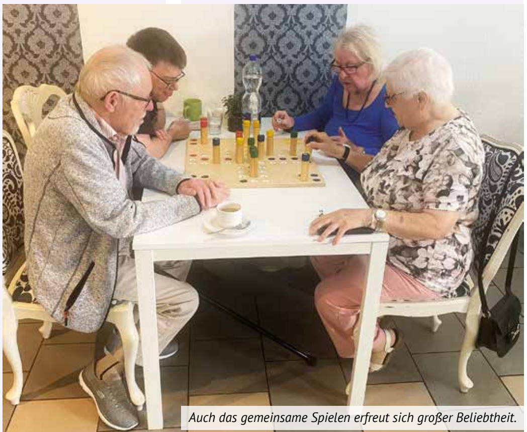
Auch das gemeinsame Spielen erfreut sich großer Beliebtheit.