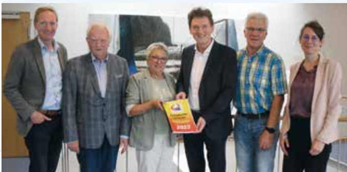
Der druckfrische Bericht der Seniorenvertretung für das Jahr 2023 wurde persönlich übergeben.