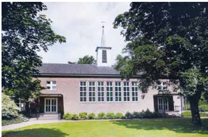
Die Herrnhuter Kirche in Neugnadenfeld.

Was zeichnet sie aus? Es ist ihre „Überkonfessionalität“ und ihr Engagement in der Ökumene, ihre enge Zusammenarbeit mit evangelischen Christen. Sie leisten weltweit aktive Missionsarbeit und sind in 35 Ländern auf 5 Kontinenten vertreten. Mehr als 1,1 Millionen Mitglieder verteilen sich in Afri-