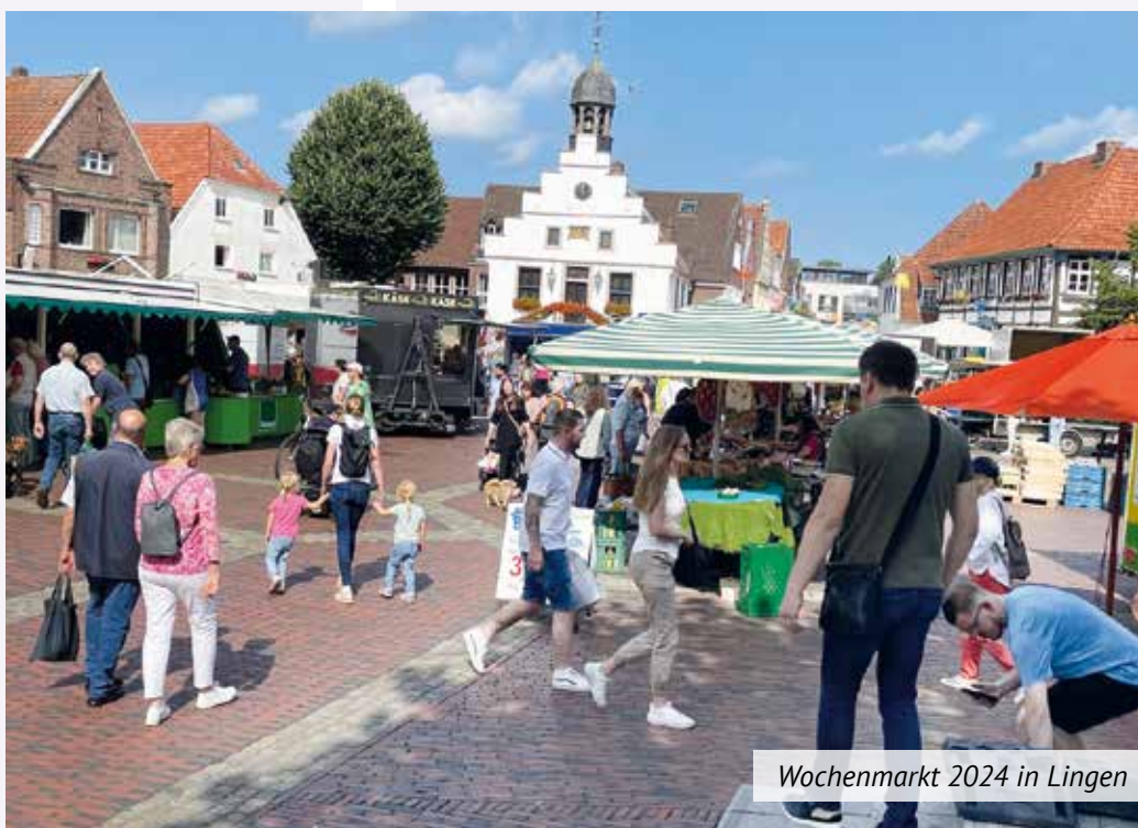
Wochenmarkt 2024 in Lingen

Fotos: Emslandmuseum (Wochenmarkt 1930), Walter Ahlrichs (Wochenmarkt 2024)