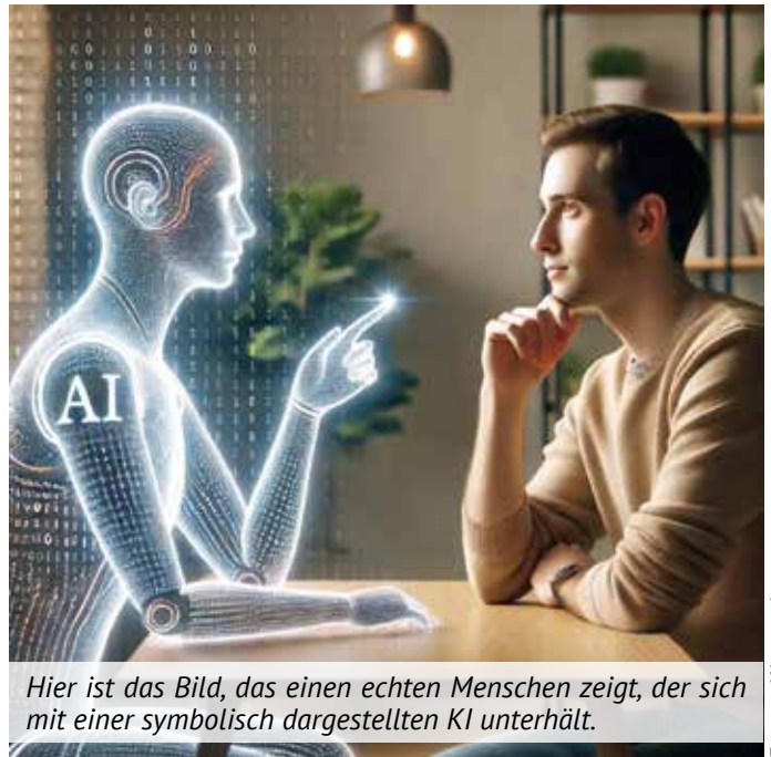
Hier ist das Bild, das einen echten Menschen zeigt, der sich mit einer symbolisch dargestellten KI unterhält.

Viele nutzen Sprachassistenten für Suchanfragen im Internet. Sprechen geht schneller als in eine