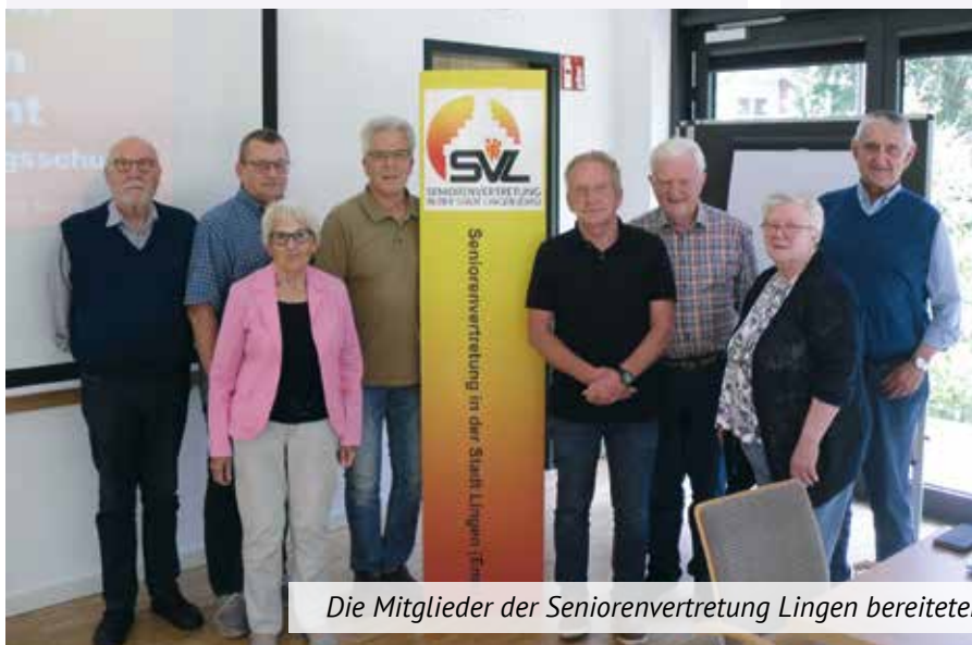
Die Mitglieder der Seniorenvertretung Lingen bereiten sich auf die Arbeit des nächsten Jahres vor.