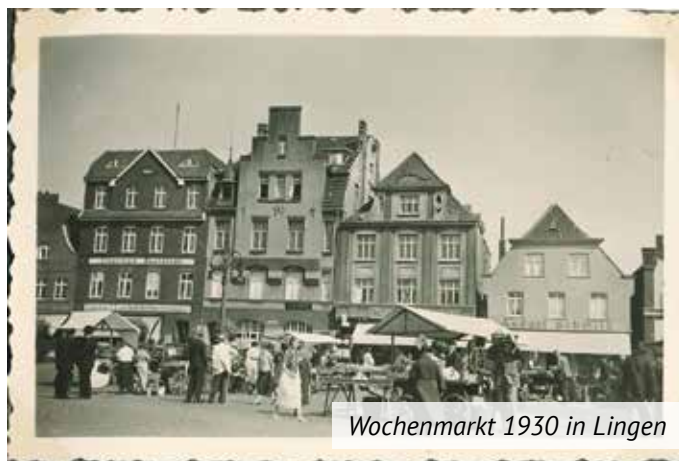
Wochenmarkt 1930 in Lingen

einen Biohof, der von Menschen mit Behinderung betrieben wird. Ein Teil des Einkaufserlebnisses ist auch das Verkaufsgespräch mit oft norddeutschem Charme. Manche Spezialitäten führen gar zu größerem Andrang. So sind zum Beispiel mediterrane Köstlichkeiten, Schinken von regionalem Weidevieh, Braten vom Bentheimer Landschwein oder Frischfisch von der Küste besonders stark nachgefragt.