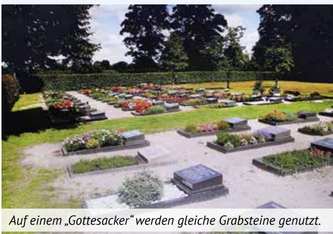
Auf einem „Gottesacker“ werden gleiche Grabsteine genutzt.