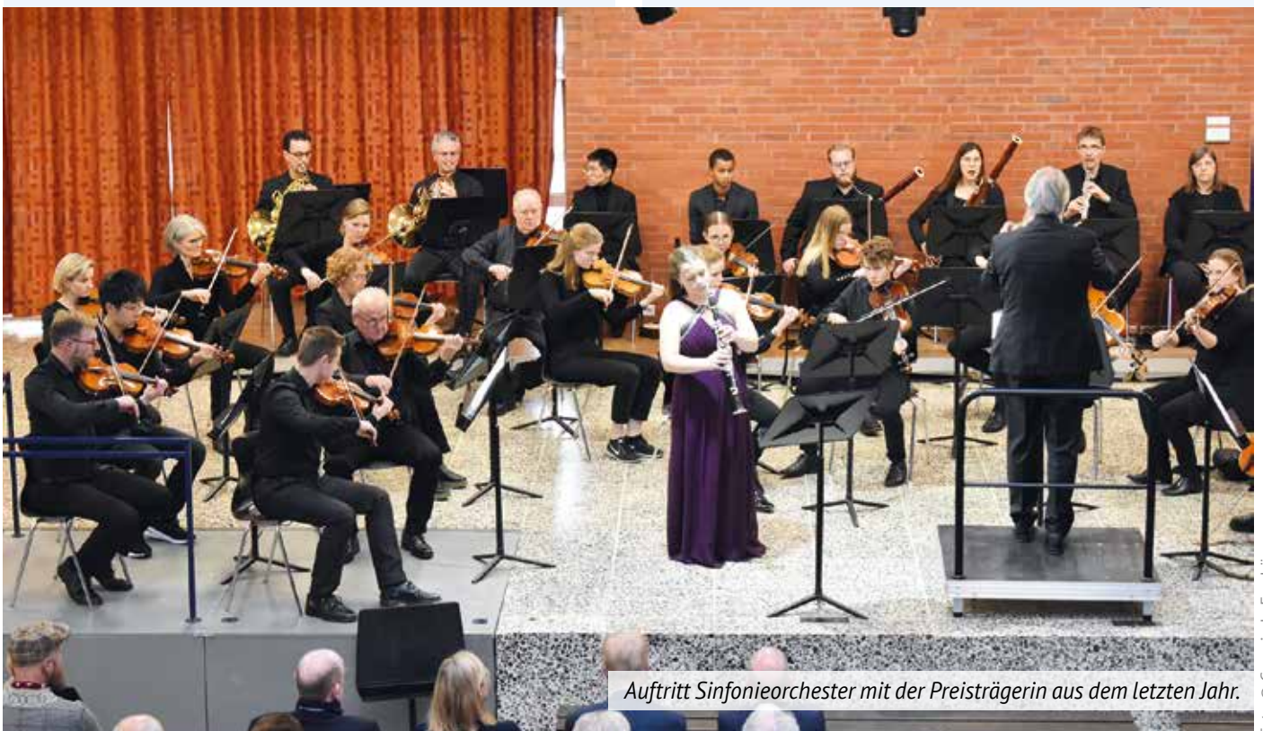
Auftritt Sinfonieorchester mit der Preisträgerin aus dem letzten Jahr.

Text: Dr. Gunther Bensch